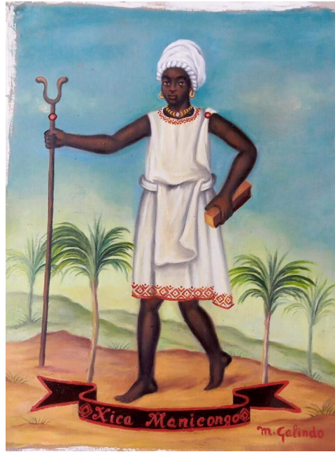
(O RETRATO, 2024)

Tratava-se de Xica Manicongo, figura histórica e, hoje, símbolo de resistência para o movimento LGBTQIAPN+ que a considera enquanto primeira pessoa trans registrada no Brasil e vítima da Inquisição Portuguesa. Francisco Manicongo foi rebatizado com nome social de Xica Manicongo em 2010 pela Associação de Travestis do Rio de Janeiro (ASTRA). Em comum, essas práticas que desafiavam as imposições sexuais e de gênero acabavam sendo encontradas por uma forma específica de controle, seja inicialmente pela via da confissão religiosa e da penitência ou do poder punitivo público-privado que se construiu na colônia.