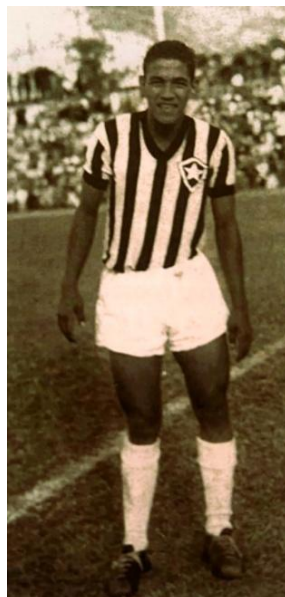
As famosas pernas tortas

Iniciava-se, assim, uma trajetória vitoriosa que o levaria à Seleção Brasileira. Castro (1995) define Garrincha como “o profissional mais amador que o futebol poderia produzir” (p. 64), argumentando que o jogador era alheio às convenções de glória, dinheiro ou estatísticas. Para ele, o futebol era um exercício puramente lúdico, uma extensão da liberdade indígena onde o drible era o fim em si mesmo.