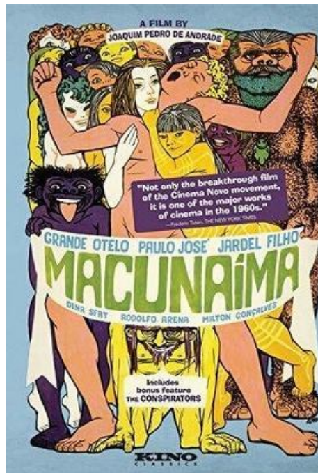
Cartaz em inglês do filme Macunaíma