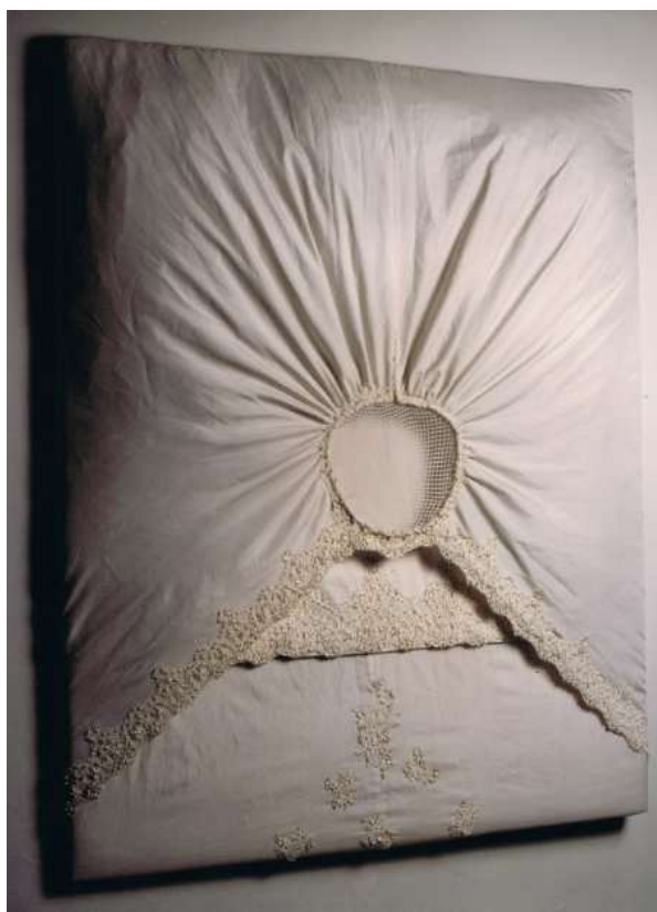
Figura 2: Beth Moysés. Rosangela . Série Pinturas-Objetos . 162 x 125 cm. 1995.