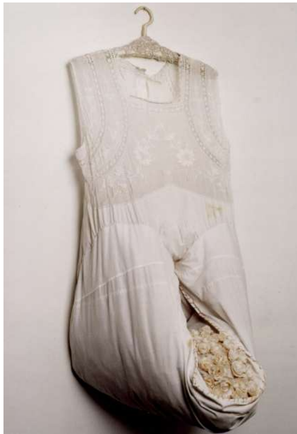
Figura 3: Beth Moysés. Ursulina . (1997).