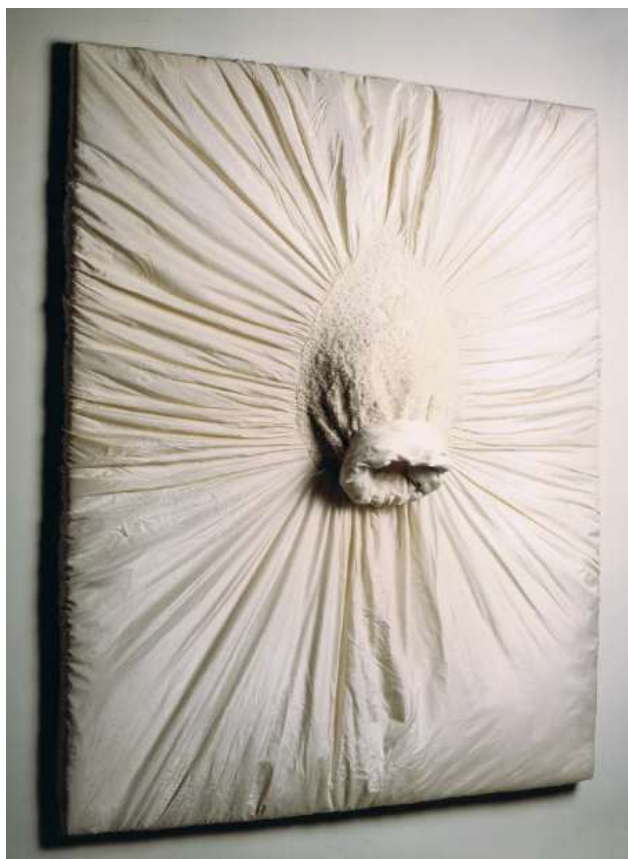
Figura 1: Beth Moysés. Eugenia . Série Pinturas-Objetos . 162 x 125 cm. 1995.