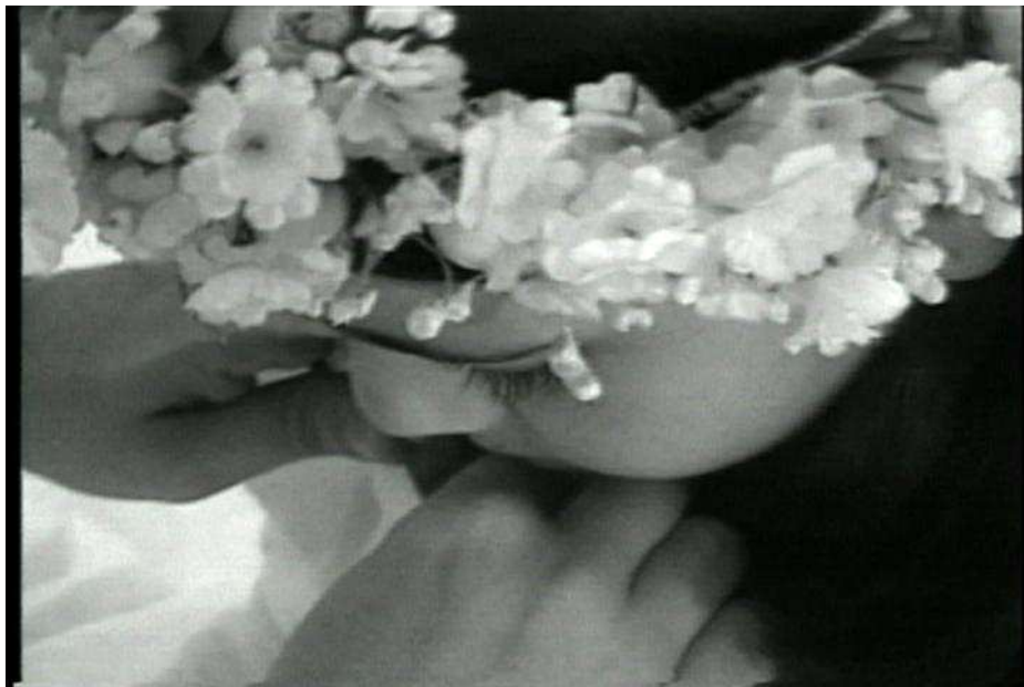
Figura 5: Beth Moysés, frame de Gotejando , 2001.