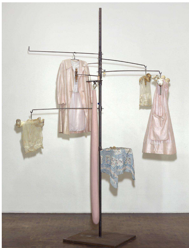
Figura 4: Louise Bourgeois, Pink days and blue days , 1997.

Nesse ponto, as características das obras, remetentes às memórias trazidas à tona através de vestes, me recordam da obra Pink days and blue days (1997) (figura 3) de Louise Bourgeois, na qual pode-se identificar uma relação generificada junto à memória infantil.